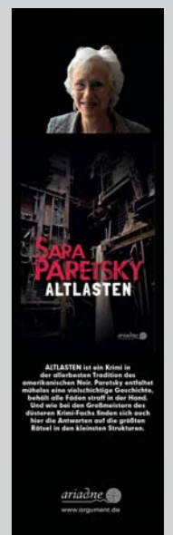
Streifenplakat Paretsky Altlasten Prolit-Nr. 95591

Prospekte & Plakate kostenlos: Bestellen Sie einfach bei Prolit die gewünschte Menge.