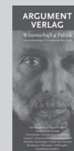
Wissenschaft & Politik Prolit-Nr. 95391

Prospekte & Plakate kostenlos: Bestellen Sie einfach bei Prolit die gewünschte Menge.