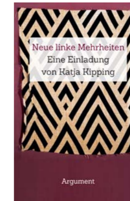
Katja Kipping Neue linke Mehrheiten Eine Einladung 96 S. · broschiert, 8 € ISBN 978-3-86754-518-1

»Die Linken-Vorsitzende fordert eine Umverteilung des Reichtums von oben nach unten, öffentliche Zukunftsinvestitionen und Daseinsvorsorge, wirksamen Klimaschutz sowie Förderung solidarischer Wirtschaftsmodelle – ganz nach dem Credo »Mehr Demokratie, weniger Markt.« taz