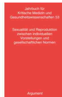
Jahrbuch für Kritische Medizin und Gesundheitswissenschaften 53 Sexualität und Reproduktion zwischen individuellen Vorstellungen und gesellschaftlichen Normen ca. 190 S., 12 x 19 cm · 978-3-86754-653-9 · 15,50 €

Universelle Anliegen, die jeden Menschen betreffen und die soziale Entwicklung wie auch die körperliche und seelische Gesundheit beeinflussen: Auf der Weltbevölkerungskonferenz in Kairo 1994 wurden Sexualität, Reproduktion und Gesundheit erstmals mit den allgemeinen Menschenrechten verknüpft und sind seitdem unter dem Begriff der sexuellen und reproduktiven Rechte gefasst. Diese Rechte sind in weiten Teilen der Welt eingeschränkt. Der Band beleuchtet die damit verbundenen Themenfelder (sexuell übertragbare Erkrankungen, Gewalt, Sexualpädagogik, Schwangerschaft, Geburt, Abtreibung, Reproduktionstechnologien, sexuelle Identität und Orientierung etc.) aus einer kritischen, sozialwissenschaftlich orientierten Public-Health-Perspektive. Behandelt werden auch derzeit in Deutschland diskutierte Fragen wie der beschränkte Zugang zu Kontrazeptiva für Menschen mit niedrigem Einkommen, die aktuelle Debatte zum § 219a, Stillnormen oder die Bedeutung von sexuellen und reproduktiven Rechten für LGBTI-Personen.