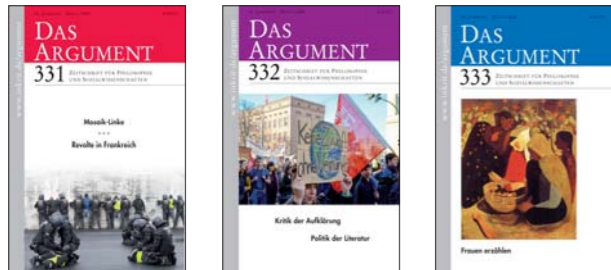
Mosaik-Linke Revolte in Frankreich Kritik der Aufklärung Politik der Literatur Frauen erzählen

Zeitschrift für Philosophie und Sozialwissenschaften