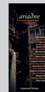
Ariadne Krimis & mehr Prolit-Nr. 95556