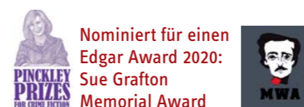
Nominiert für einen Edgar Award 2020: Sue Grafton Memorial Award