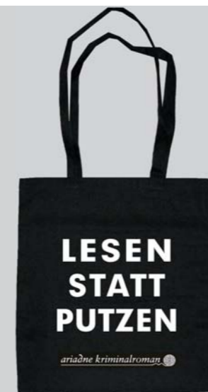
Tragetasche LESEN STATT PUTZEN Leichte stabile Kunstfaser, 38 x 42 cm, lange Henkel EK 1,50 € pro Stück Empfohlener VK: 3 € Prolit-Nr. 93978