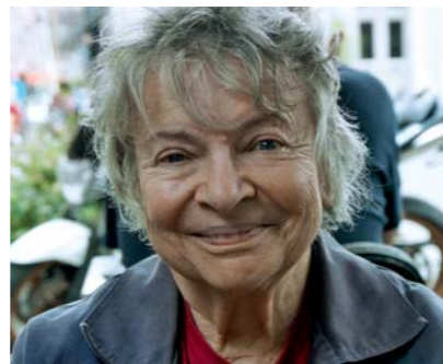
Dominique Manotti